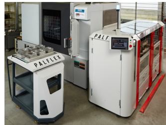
Le Palflex et son chariot.

Doté d'un écran tactile rotatif pour un meilleur pilotage, le Palflex est connecté sur le réseau de l'entreprise ou en WIFI pour suivre la production. "Au moindre arrêt ou défaut, cela permet d'agir aussitôt même à distance, et de poser un diagnostic ou de lancer un dépannage si nécessaire", précise Hervé Himmer. Bien entendu, le Palflex est livré avec un système de bridage automatique. Avec 2,5m 2 , d'occupation, il n'encombre que très peu